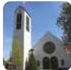
WERL: St. Norbert, Kucklermühlenweg 6

II i IV niedziela miesiąca – godz. 16:00