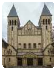
DORTMUND: St. Anna, Rheinischestr. 174

w każdą niedzielę godz. 8:00, 10:00, 12:00 i 18:30 w poniedziałki godz. 10.00, od wtorku do soboty – godz. 18.30, w I piątek miesiąca godz. 10:00 i 18:30.