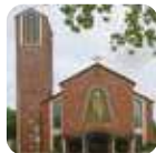
HAMM: St. Josef, Josef Str. 4

w każdą niedzielę o godz. 13:30, w każdy poniedziałek (oprócz wakacji) – godz. 18:00