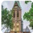
HERNE: St. Laurentius, Hauptstr. 317

I, III, V niedziela miesiąca – godz. 16:00