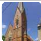
WITTEN: St. Franziskus, Herbedestr. 28

w każdą niedzielę o godz. 13:30, w każdy poniedziałek (oprócz wakacji) – godz. 18:00